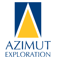
Figure 1 - Press release dated December 11, 2023